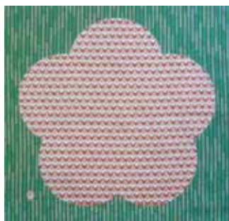
101 松竹梅 赤