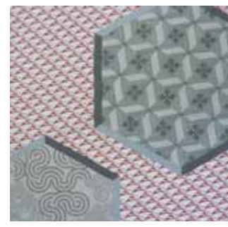
106 つるかめ 赤