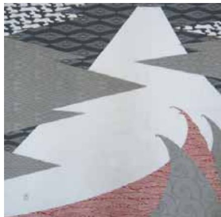
303 一富士 グレー