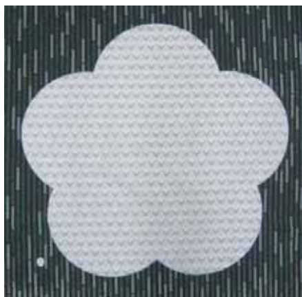
302 松竹梅 白