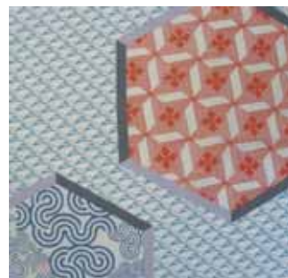
105 つるかめ ブルー