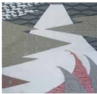
103 一富士 グレー