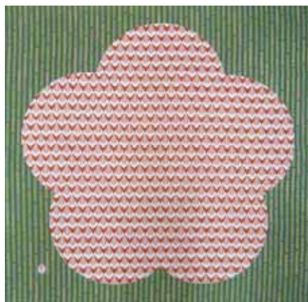
301 松竹梅 赤