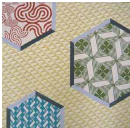
304 つるかめ 金茶