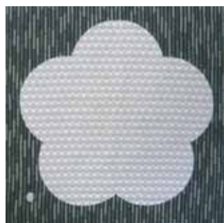
102 松竹梅 白